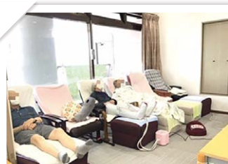
エアマッサージャー・足湯