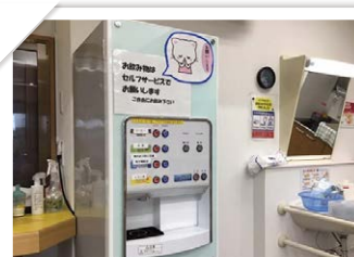
ドリンクサーバー