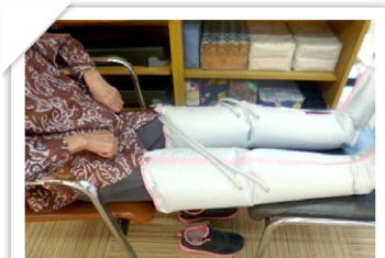
生活機能訓練 (下膳)