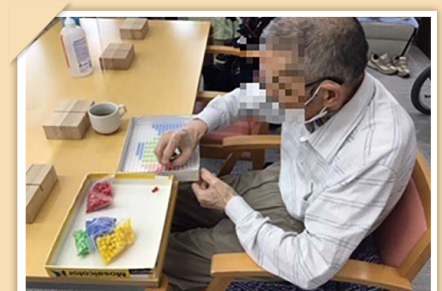
個別アクティビティ