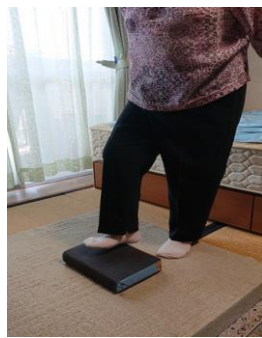
台を使用した 下肢筋力増強運動