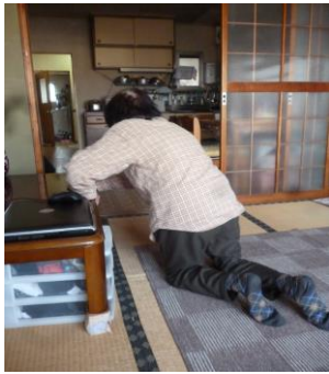
床からの立ち上がり