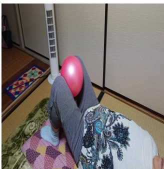
ボールを使用した 下肢筋力増強運動