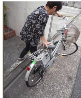
自転車昇降・走行等