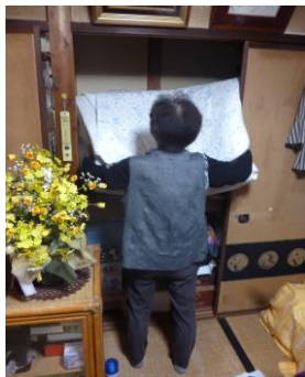
布団の上げ下ろし