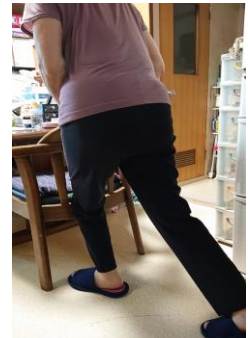
椅子を使用した ストレッチ