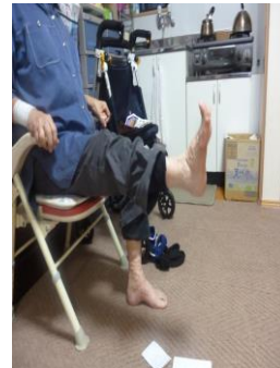
椅子に座って 下肢筋力増強運動