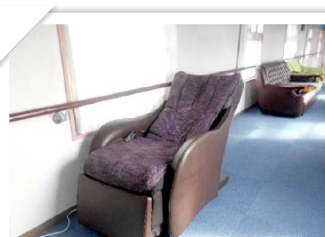
景色を楽しみながらマッサージ