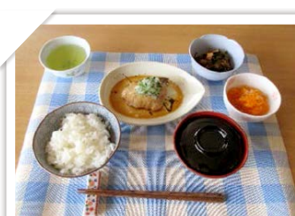
厨房から毎日熱々の昼食が運ばれてきます。