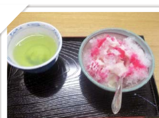
夏には冷たいかき氷!