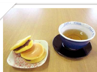
おやつは毎日ご利用者様と一緒に作っています。手作りが一番♪