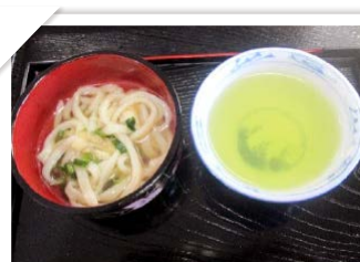
うどん作り 力を合わせて麺から作りました。