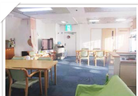
グリーンとブルーの配色で、落ち着いた雰囲気です。