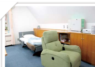
休憩室も完備。体調がすぐれないときでも、落ち着いた個室で休めるから安心。