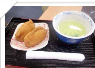
稲荷寿司作り お揚げさんも甘辛に上手に煮えました。