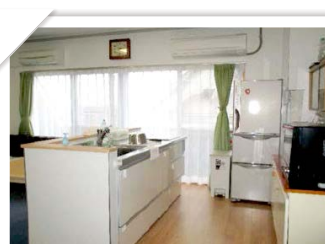
毎日こちらのキッチンでご利用者様と一緒におやつを作っています。